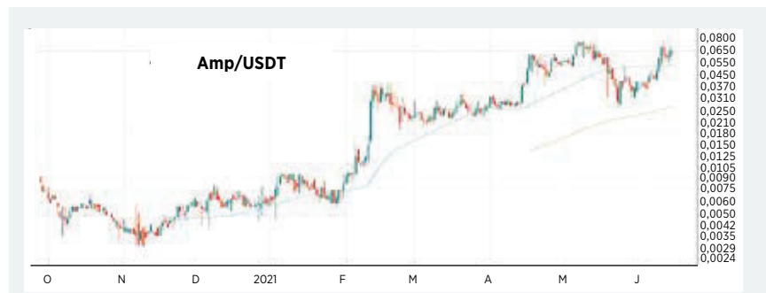
Amp war von den Kursrückgängen am Kryptomarkt im Mai zwar ebenfalls stark betroffen, vergangene Woche konnte der Token aber sogar neue Allzeithochs erreichen.

zu anderen Point-of-Sale-Lösungen benötigen die Anwender bei Flexa keine eigene Hardware, was die Akzeptanz dieser Lösung deutlich erhöht. Amp kommt aber auch außerhalb des Flexa-Netzwerks zum Einsatz.