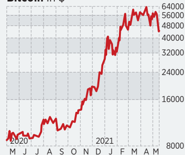
Bitcoin in $

Kurzfristig besteht die Gefahr, dass der Bitcoin bis auf die bei unter 40 000 Dollar verlaufende 200-Tage-Linie fällt. Der langfristige Aufwärtstrend ist aber intakt.