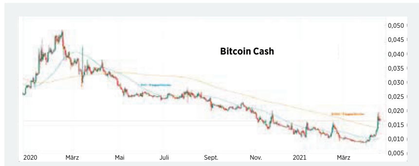
Bitcoin Cash konnte den Anfang 2020 eingeschlagenen Abwärtstrend gegen Bitcoin mit dem Sprung über die 200-Tage-Linie endgültig brechen. Die relative Stärke dürfte anhalten.

ihren Blick auf deutlich hinter ihren Allzeit-höchstständen zurückgebliebene Coins richten. Ein Paradebeispiel dafür ist Bitcoin Cash, die Ende 2017 in der Spitze 4000 Dollar erreichte und damit das Vierfache des aktuellen Preises.