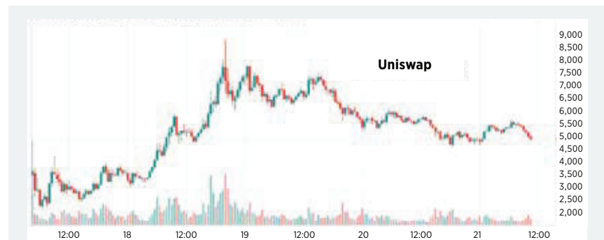
Der Uniswap-Token zeigte in den wenigen Tagen seit Handelsbeginn heftige Schwankungen. Für risikobereite Trader könnten Kurse um vier Dollar ein interessanter Einstieg sein.

Nutzer an diese ausgeschüttet. Dies wiederum ist der Anreiz für die Nutzer, den Liquiditätspool mit ihren Einlagen zu bestücken. Allerdings: Kursverluste der hinterlegten Token können diese Renditen natürlich deutlich übersteigen.