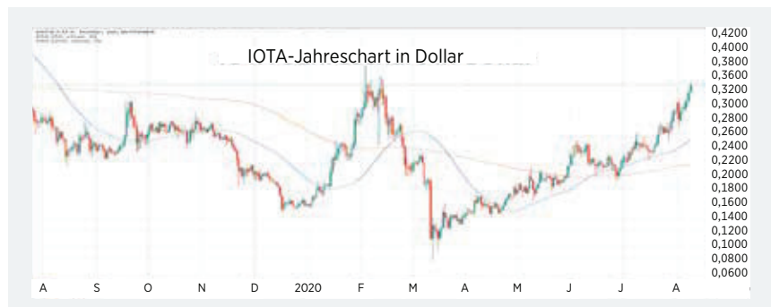
IOTA zeigt seit dem Corona-Crash einen sehr deutlichen Aufwärtstrend . Der Kursanstieg wurde zuletzt noch steiler, das Potenzial in den nächsten zwei Monaten beträgt 50 Prozent.

in sieben europäischen Städten getestet. Marktbeobachter sehen die Entwicklungen bei IOTA im zweiten Halbjahr sehr positiv mit entsprechenden Auswirkungen auf den Kurs, dessen Entwicklung gegenüber anderen Coins zurückgeblieben ist.