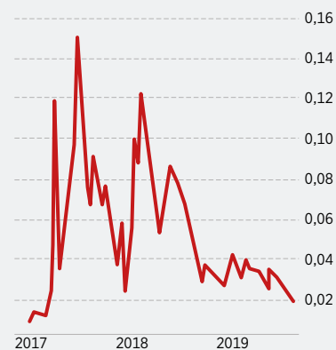
Ethereum versus Bitcoin

Hohe Schwankungsbreite: Extrem volatil zeigt sich Ethereum im Vergleich zum Bitcoin. Vor drei Jahren lag der Altcoin sogar noch etwas unter der aktuellen Marke.